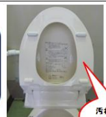
汚れがつきやすい