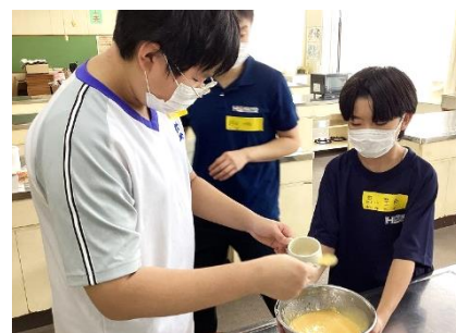
家庭科「カップケーキづくり」