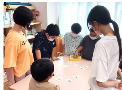
特別活動「レクリエーション」